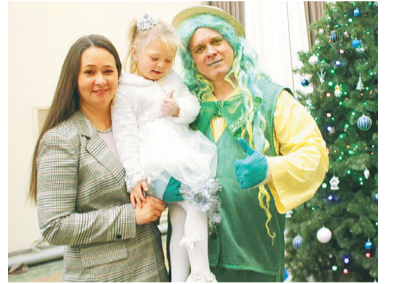
На новогодней ёлке в ДК