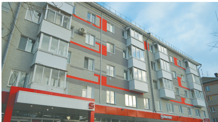
Ул. Корсуньская, 29 после капитального ремонта

ритория относится к ведению муниципалитета. Например, за уборку снега во дворах домов по ул. Сестрорецкой отвечает управляющая компания, а вот за уборку самой улицы отвечает муниципалитет. С границами территорий подробно можно ознакомиться на публичной кадастровой карте в сети Интернет.