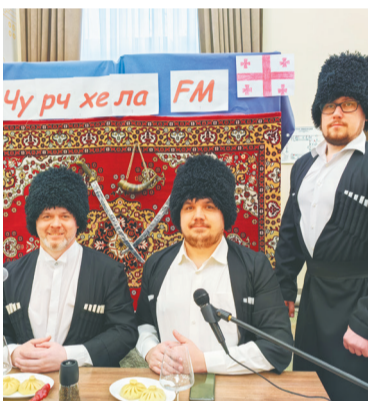
Сборная команда Голованово