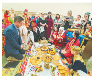
Конкурс национальных блюд

Блюда, которые приготовили конкурсанты, поражали своим вкусом и разнообразием. «Найская халва из рыбы, таджикский соус из сушёных творожных шариков, удмуртские пирожки с калигой, еврейский фалафель и армянская долма, остякская (хантыйская) вяленая оленина – лишь малая толика того, от чего ломились столы», – делится впечатлением член жюри фестиваля, доцент кафедры теории и истории музыки