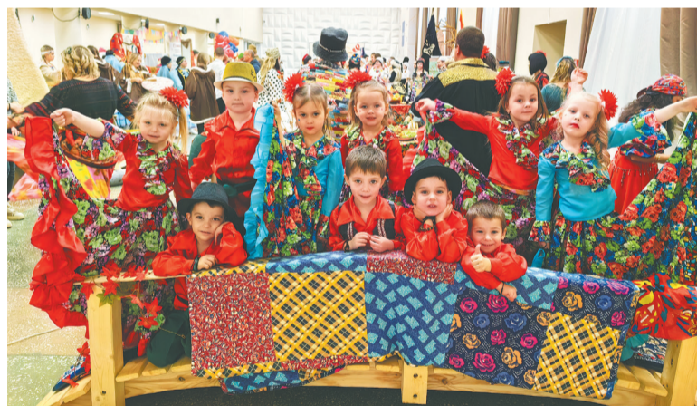
Команда детского сада Голованово