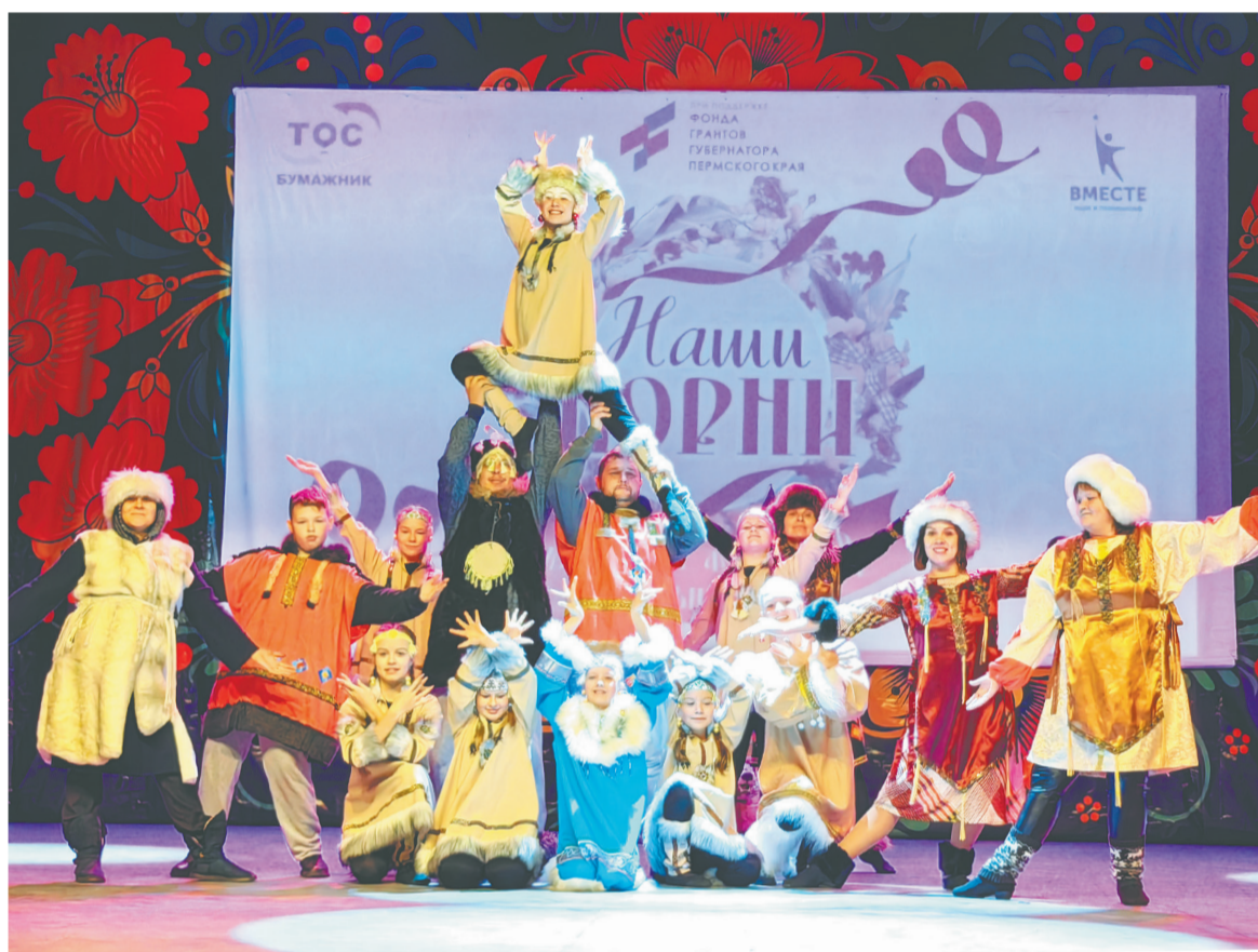
Команда детской школы искусств № 11 – победители фестиваля