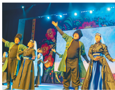
На сцене ДК «Бумажник»