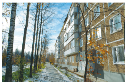
Ул. Бумажников, 20

Здесь стоит отметить, что управляющая компания отвечает за уборку только той территории, которая относится к дому. Как правило, это дворы, придомовые тротуары, подъезды и парковки. Вся остальная тер-