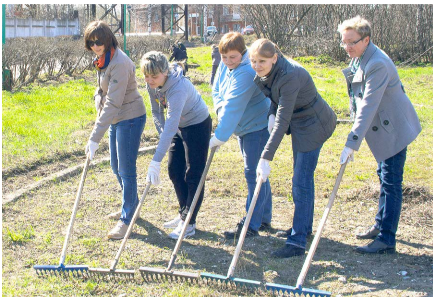
Площадку для будущей клумбы уже подготовили

Все идеи тщательно проанализировали, классифицировали, оценили. Комитет по инновациям, который постоянно ведет свою работу, заслу-