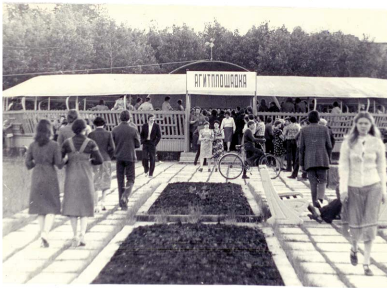
Так выглядела агитплощадка в 1970-е

«Традиция субботников зародилась еще при директоре